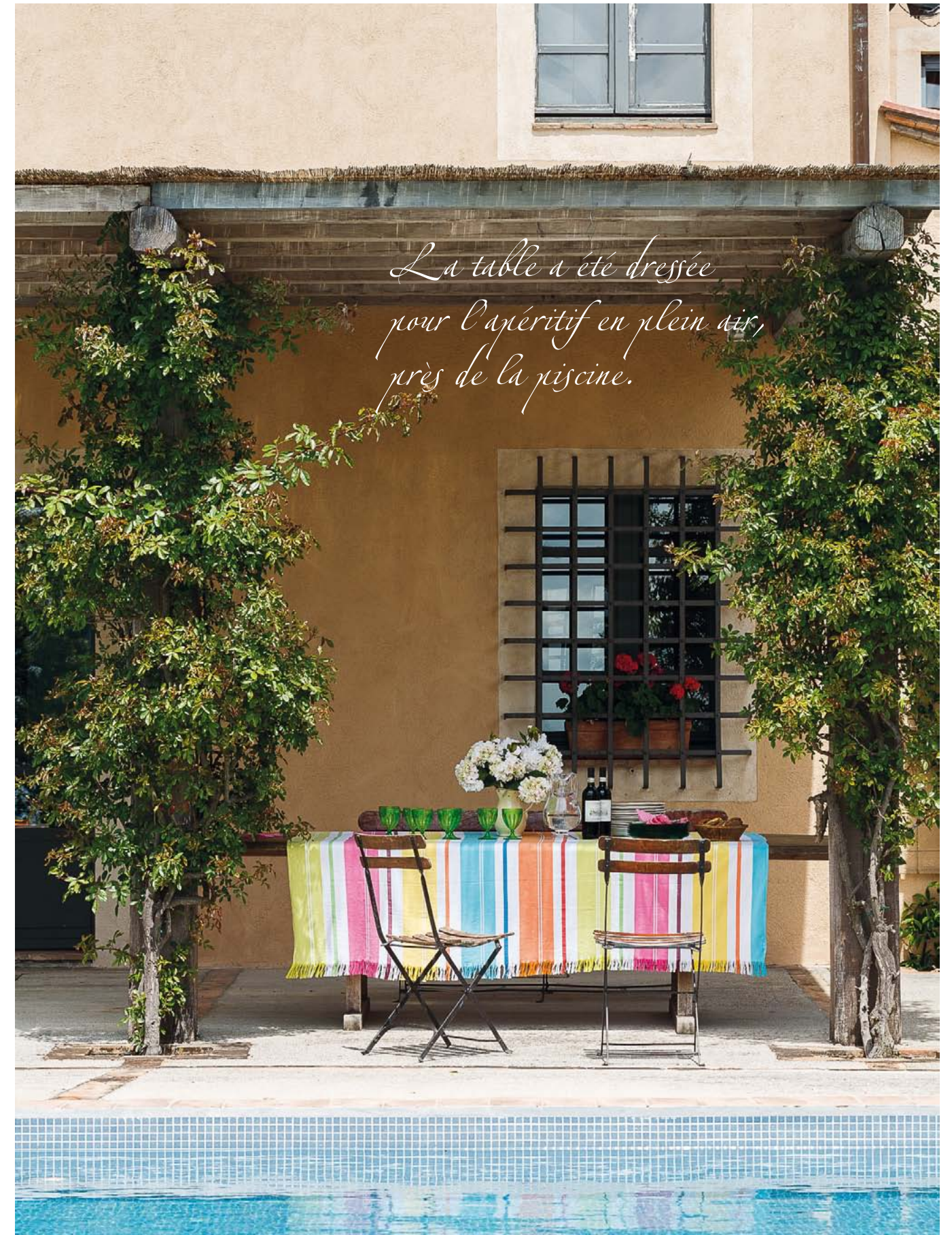
La table a été dressée pour l'apéritif en plein air, près de la piscine.