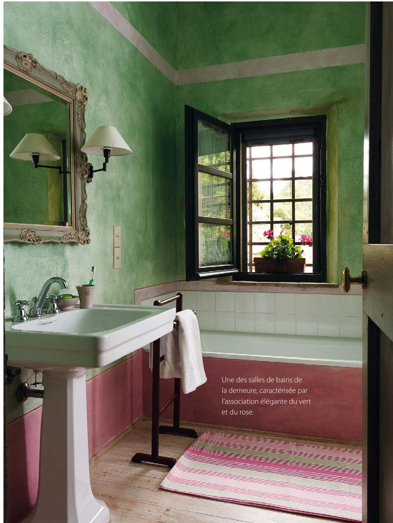
Une des salles de bains de la demeure, caractérisée par l'association élégante du vert et du rose.